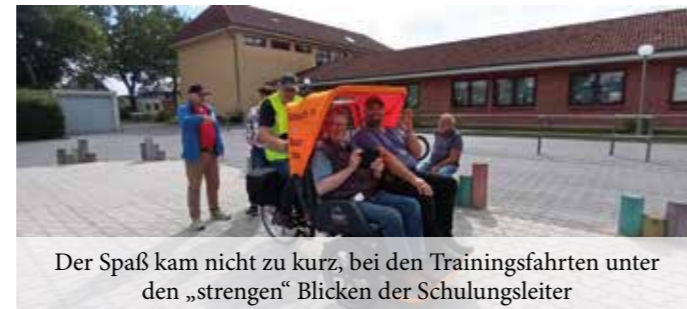
Der Spaß kam nicht zu kurz, bei den Trainingsfahrten unter den „strengen“ Blicken der Schulungsleiter